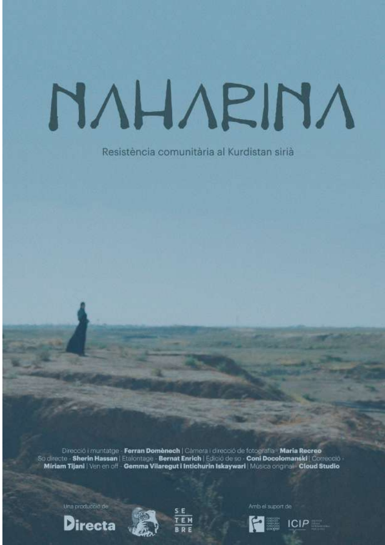
Pòster documental Naharina

La col·laboració de la Fundació amb la realització del documental ha consistit en un impuls de 800 euros que han ajudat a fer-lo possible.