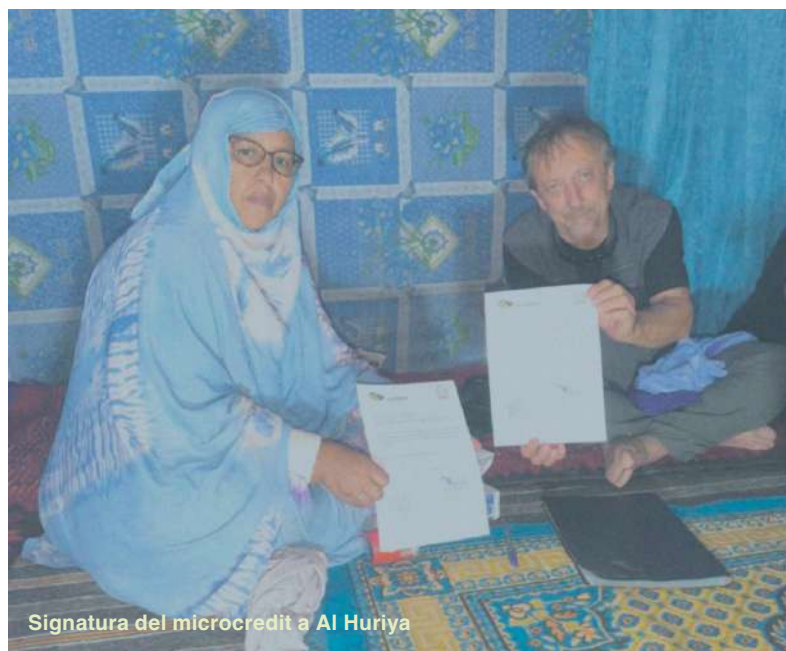
Signatura del microcredit a Al Huriya

La Fundació ha fet aquest 2024 una do- nació de 1800 euros per augmentar les donacions de microcrèdits i assegurar la continuïtat de projectes que funcionen, obrint portes a noves propostes transfor- madores.