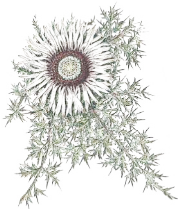
Eguzkilo Euskal Herria