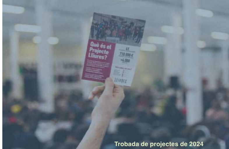
Trobada de projectes de 2024

Escola d'idiomes popular autogestionada des d'on practicar el suport mutu i la resistència antiracista.