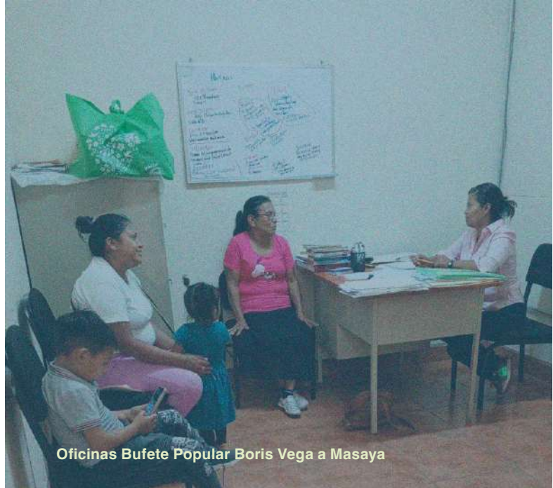
Oficinas Bufete Popular Boris Vega a Masaya

Por lo que se refiere a las materias atendidas han sido en un 50% notarial, un 12% civil, un 12% penal y el resto familia, laboral, organizativo y financiero y otros. Además, se han realizado 181 consultas jurídicas, manteniendo su coste en un precio simbólico de 50 córdobas (1,25 euros), para facilitar el primer acceso a los servicios legales a las personas con menos recursos.