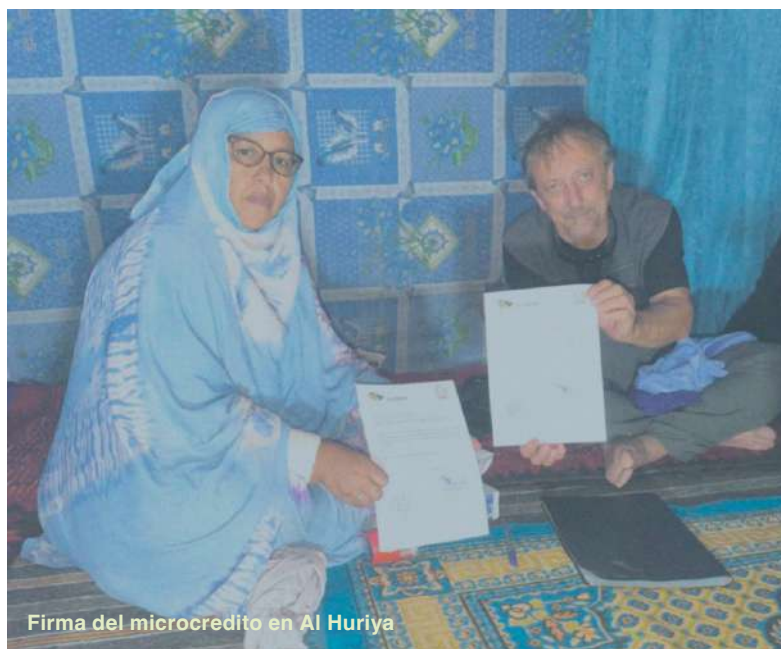
Firma del microcrédito en Al Huriya

Esta estructura garantiza que las iniciativas respondan de manera directa a las realidades del territorio, al tiempo que promueve la autonomía, la justicia de género y la sostenibilidad a largo plazo.