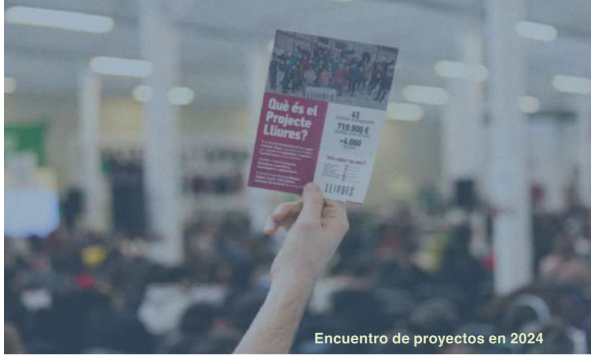
Encuentro de proyectos en 2024

XARXA DE SUPORT MUTU ATENEU POPULAR DE L'ALT URGELL I SEU D'URGELL | 16.000,00 € Adecuación de un espacio con cocina-obrador, aula y herramientas compartidas.