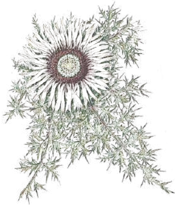
EH - Eguzkilore