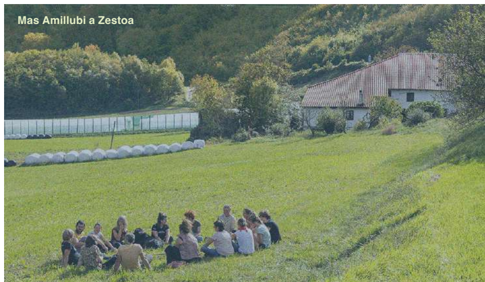
Mas Amillubi a Zestoa

Gracias a la campaña impulsada por la Fundación, se han recaudado 145.435,95 euros procedentes de 829 donaciones, que han permitido dotar al proyecto de los recursos técnicos necesarios para dar inicio a esta nueva etapa. La alianza entre Amillubi y la Fundación forma parte de una estrategia agroecológica más amplia, concebida desde el pueblo y para el pueblo, que busca fortalecer una red que ponga en el centro la vida, la tierra y la soberanía alimentaria.